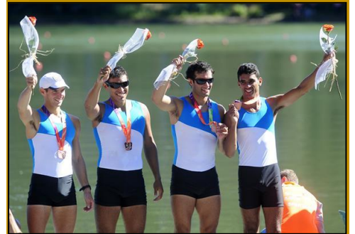
Equipo M4- Remo