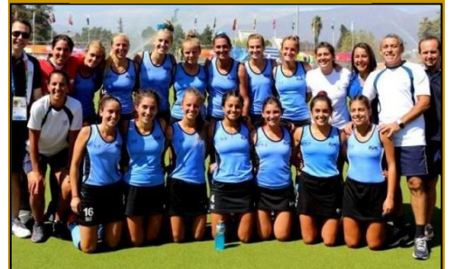
Selección Femenina de Hockey