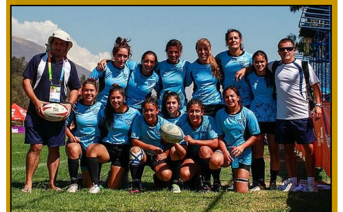
Selección Femenina de Rugby