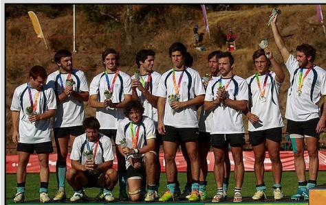
Selección Masculina de Rugby